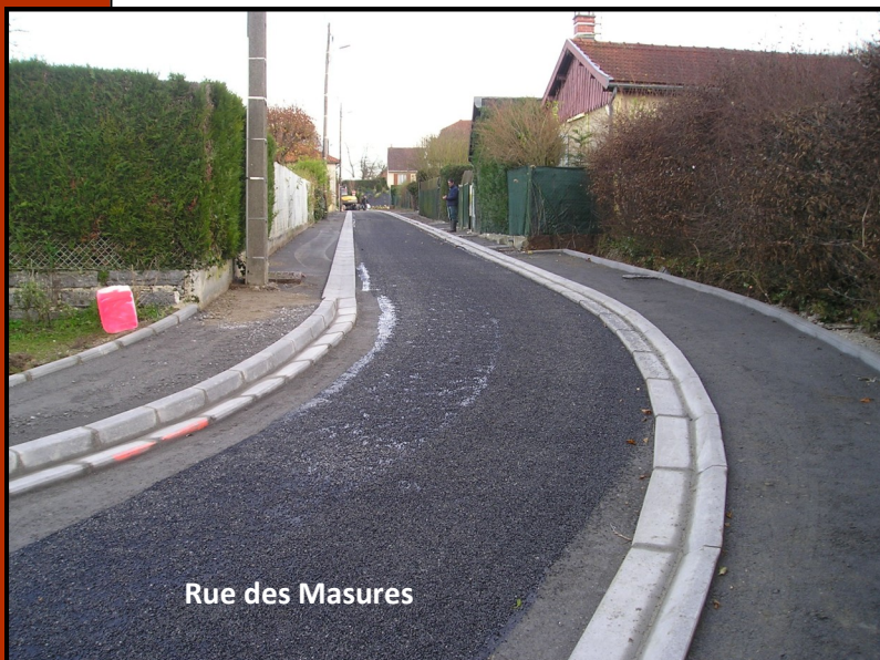
Rue des Masures

Le budget global s'élève à 191 000 € HT dont 15 000 € HT d'assainissement eaux pluviales à la charge de la communauté de Communes et sont financés de la façon suivante :